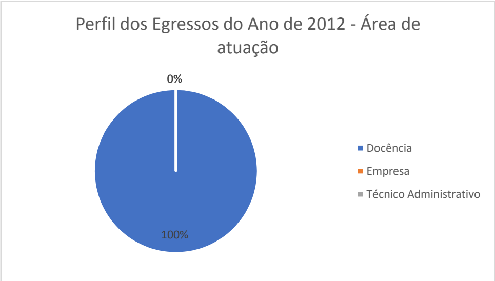
Figura 2 – Perfil dos Egressos de 2012 – Área de atuação.