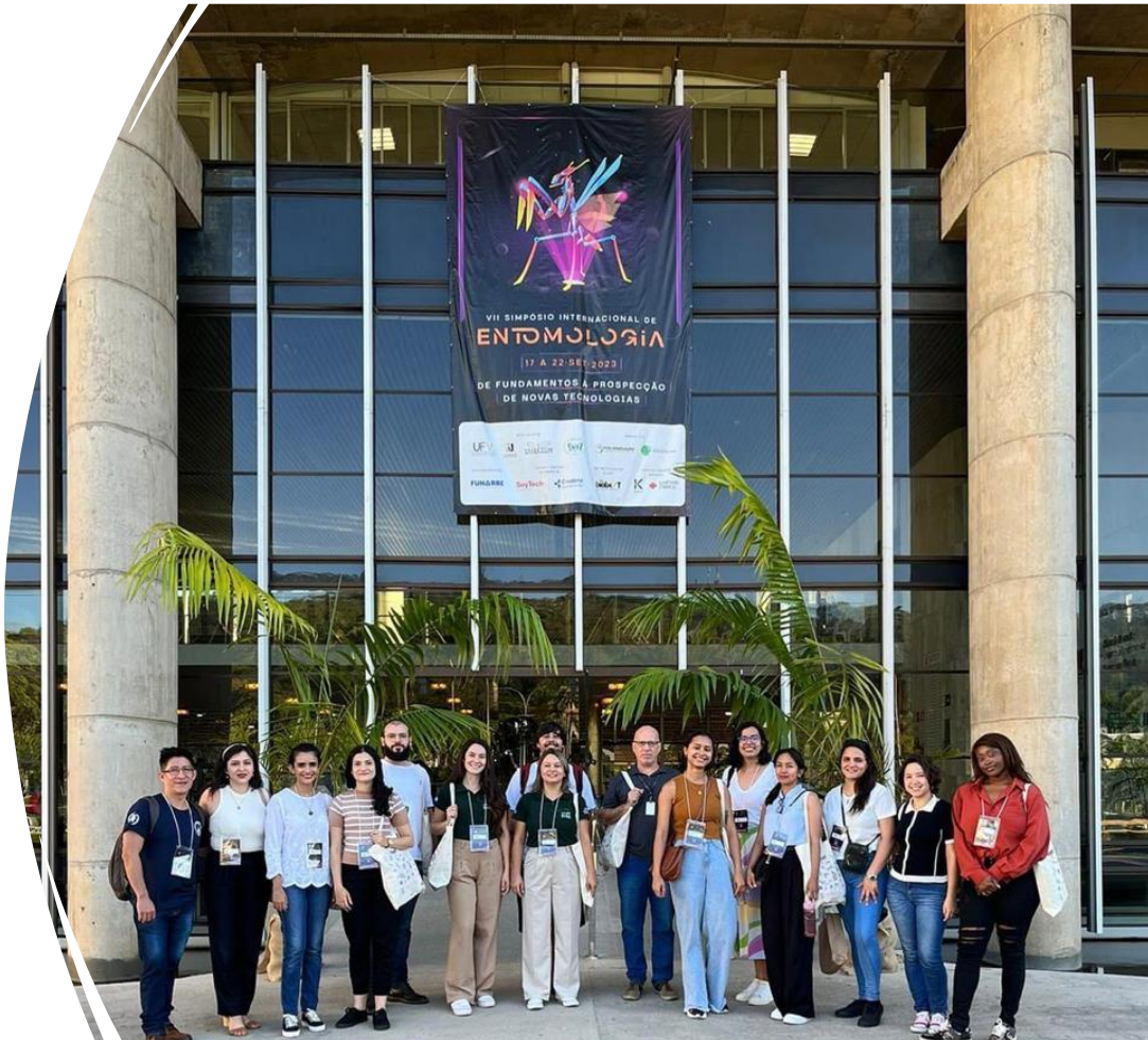
Ganhadores do Game of Bugs – Representando o PPG Entomologia UFLA

Estudantes e professores participantes do VII Simpósio Internacional de Entomologia, em Viçosa – MG 2023